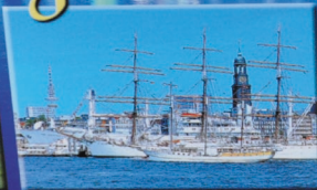
Hafen und "Mischer"