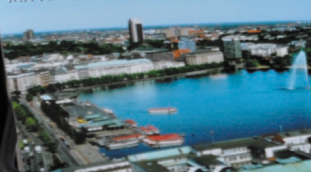
BINNENÄLTESTER MIT JUNGFERNFLOTTE