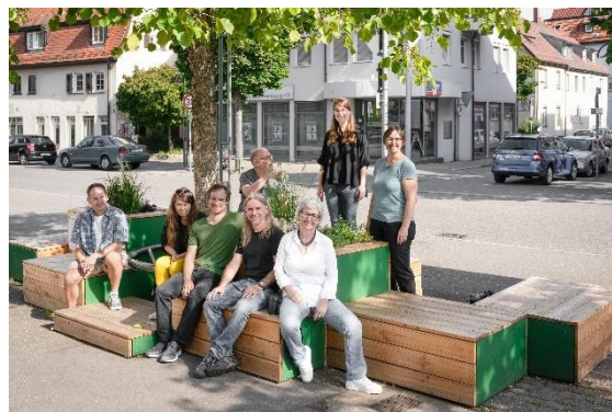
Abb. 5: Bauwerkstatt Stuttgart-Wangen

der öffentliche Raum gewissermaßen als Labor für Experimente genutzt werden konnte (Oswalt/Overmeyer/Misselwitz 2014: 14). Dadurch wurden Erlebnisräume geschaffen, um neue Impulse für die Gestaltung des Platzes anzustoßen. Die Ergebnisse wurden mit den Bewohner*innen diskutiert und werden von der Stadt Stuttgart in die Planungen zur Neugestaltung des Keltervorplatzes einbezogen. Die Bauwerkstatt selbst wurde mit einem Imagefilm 14 dokumentiert, außerdem wurde eine Bauanleitung des entstandenen Sitzmöbels 15 produziert, um auch in anderen Stadtbezirken eine solche Aktion zu ermöglichen.