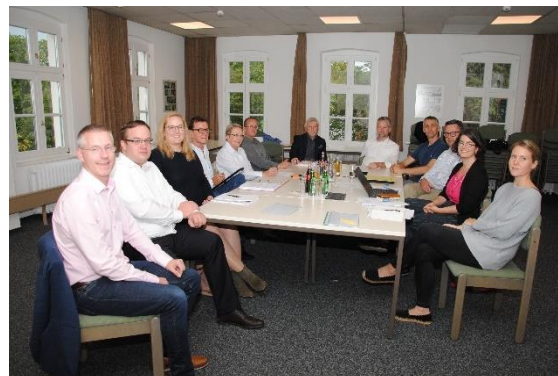
Abb. 4: Sitzung zur Vorbereitung der Gründungsversammlung der Bürgergenossenschaft Holzminden

Die Bürgergenossenschaft Holzminden eG 12 verfolgt das Ziel, durch Erwerb, Sanierung und Wiedernutzung leerstehender oder mindergenutzter Gebäude die Wohnfunktion in der Altstadt zu stärken und das kleinteilige Gewerbe zu unterstützen. Dies soll perspektivisch zur innerstädtischen Belebung beitragen. Es ist den Initiatoren der Genossenschaft ein wichtiges Anliegen, Teile der Sanierungsarbeiten in gemeinschaftlicher Eigenleistung zu erbringen und dadurch auch den Gemeinschaftsinn innerhalb der Stadt zu stärken. Die Genossenschaft soll auch dazu dienen, weitere Teile der Bewohner*innen für die Entwicklung der Altstadt zu sensibilisieren und aktiv an der Weiterentwicklung des eigenen Wohnumfeldes und des eigenen Zentrums zu beteiligen.